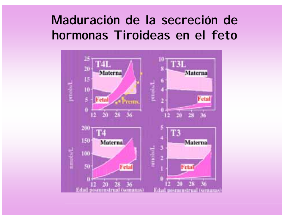
Fig. 2.-Maduración de las hormonas tiroideas

Las concentraciones de T4L en sangre fetal son superiores a las obtenidas en prematuros de la misma EG lo que indica que una parte importante de la T4L fetal es de origen materno.